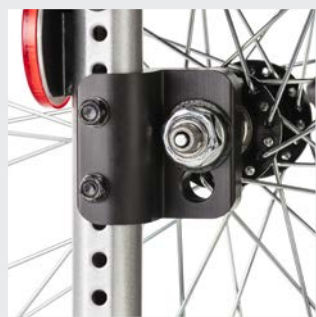
Rallonge de l'empattement en tournant le variobloc vers l'arrière