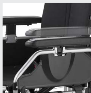
Accoudoir réglable en hauteur avec appui-bras réglable en profondeur