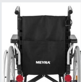
Dossier réglable en série