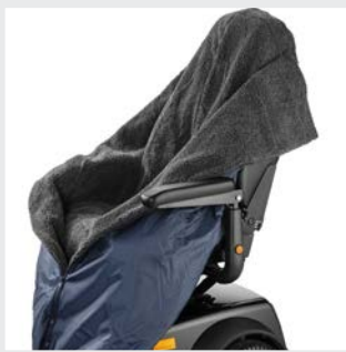
Sac de jambes