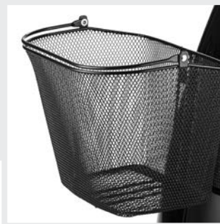
Corbeille à provisions