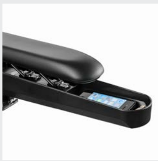
Vide-poches dans les accoudoirs