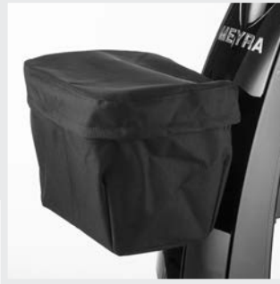
Protection intempéries pour corbeille à provisions